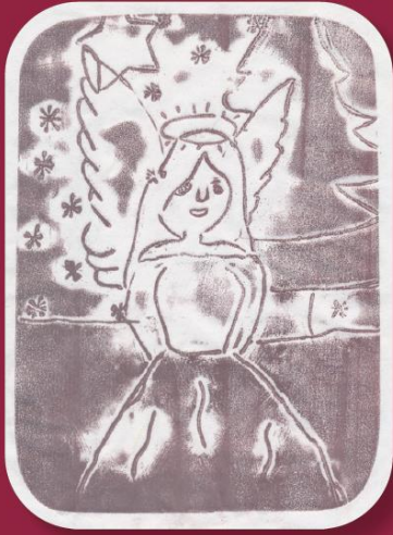
Emilie Stöhr Klasse 7b