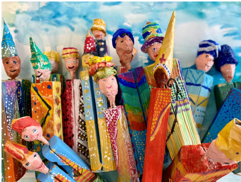
Gemeinschaftsprojekt der Klassen 6 und 7

„Warte nicht darauf, dass die Menschen Dich anlächeln - Zeige ihnen, wie es geht!“