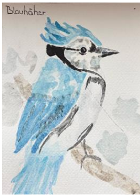
Beide Bilder von Johanna Burgert, 9e