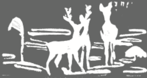
Linolschnitt, der Fachschaft Kunst